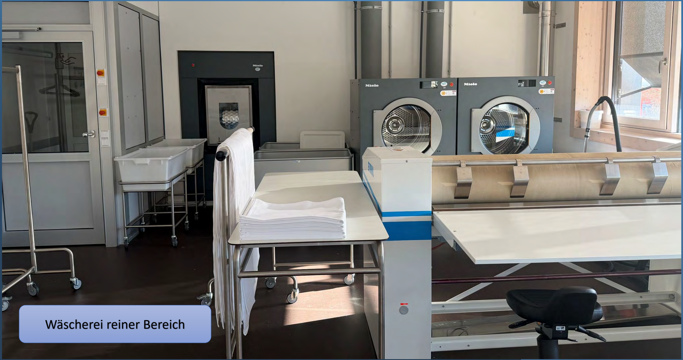
Wäscherei reiner Bereich