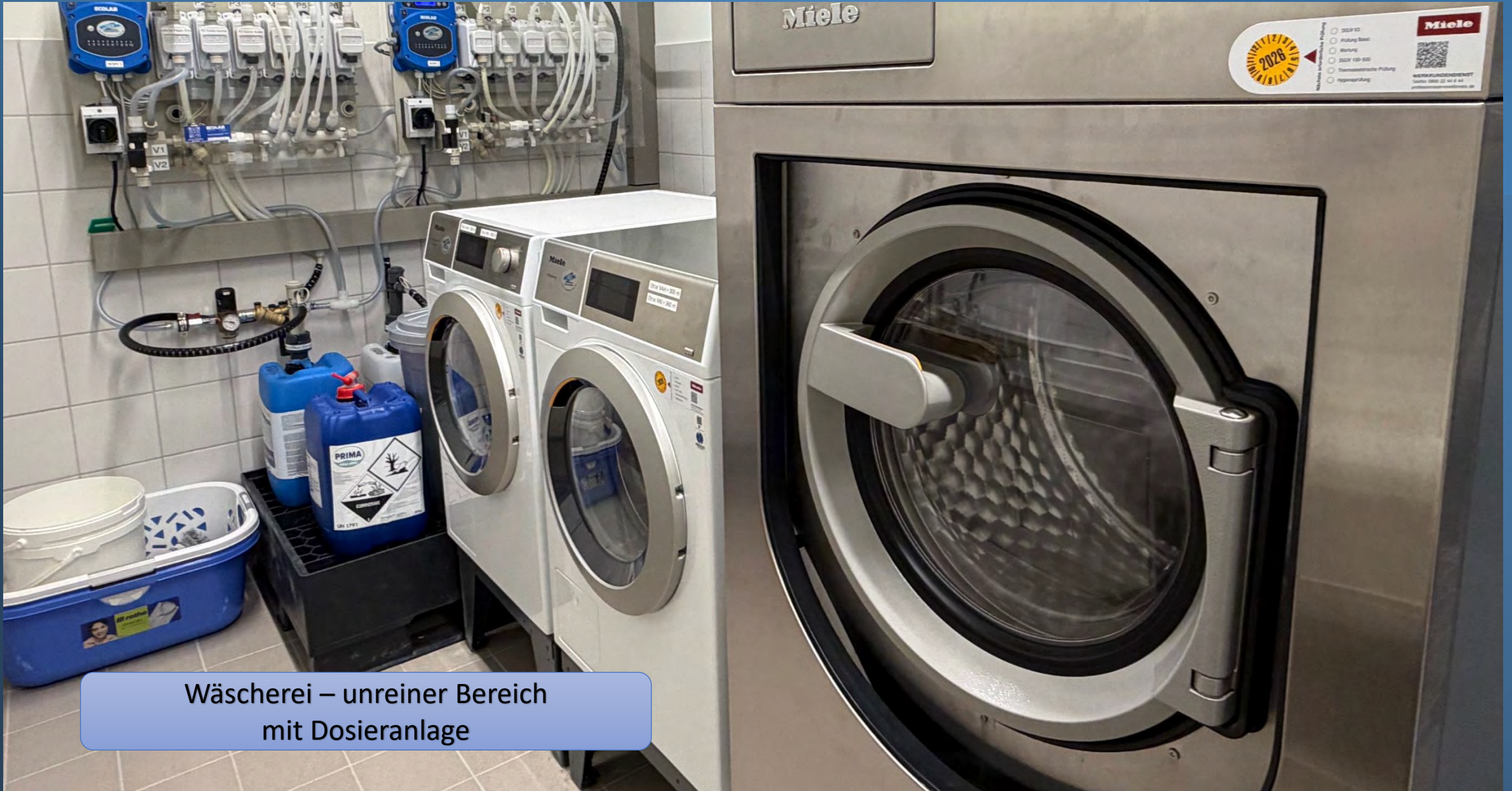
Wäscherei – unreiner Bereich mit Dosieranlage