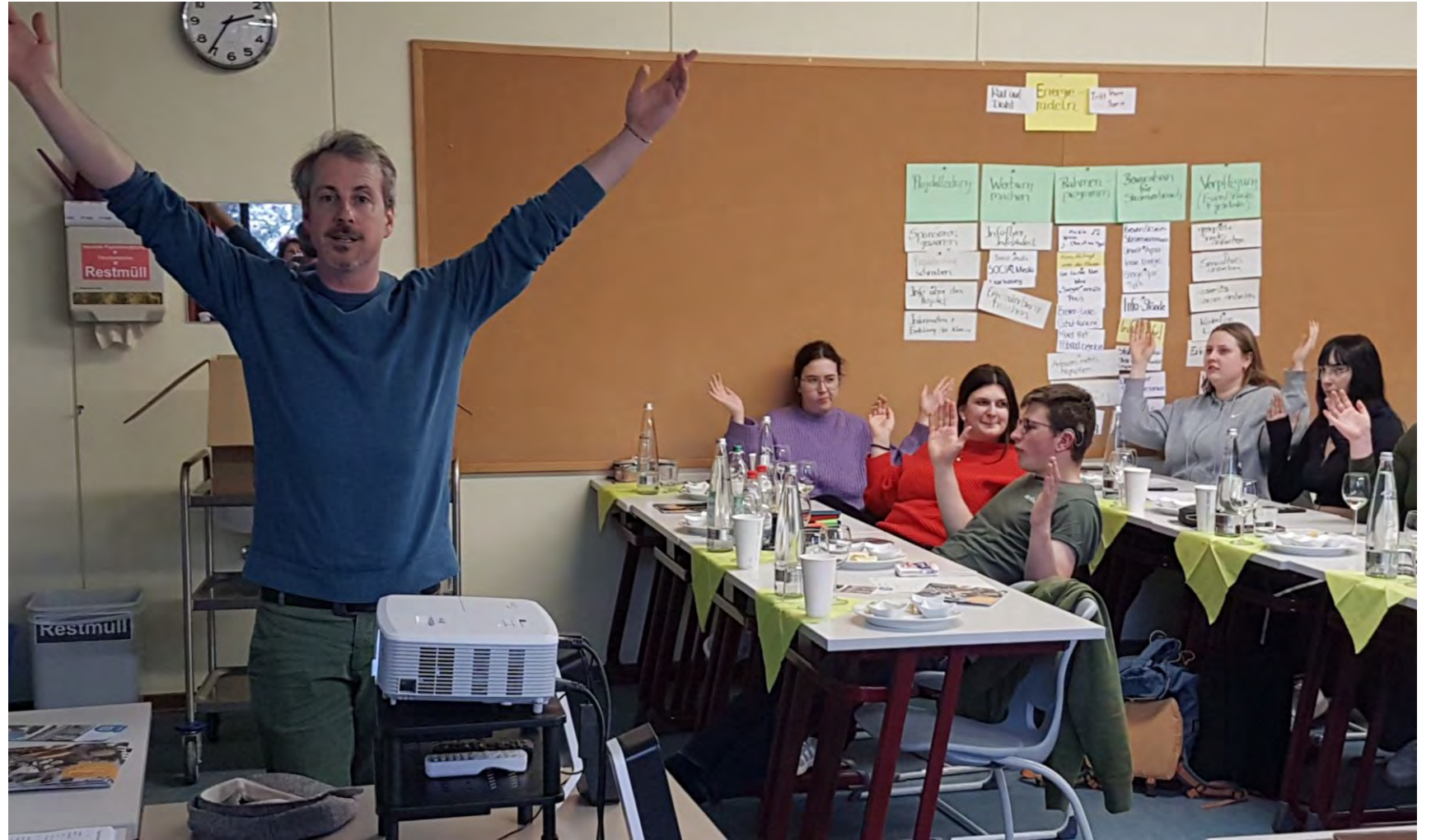
Schulung vom deutschen Weininstitut