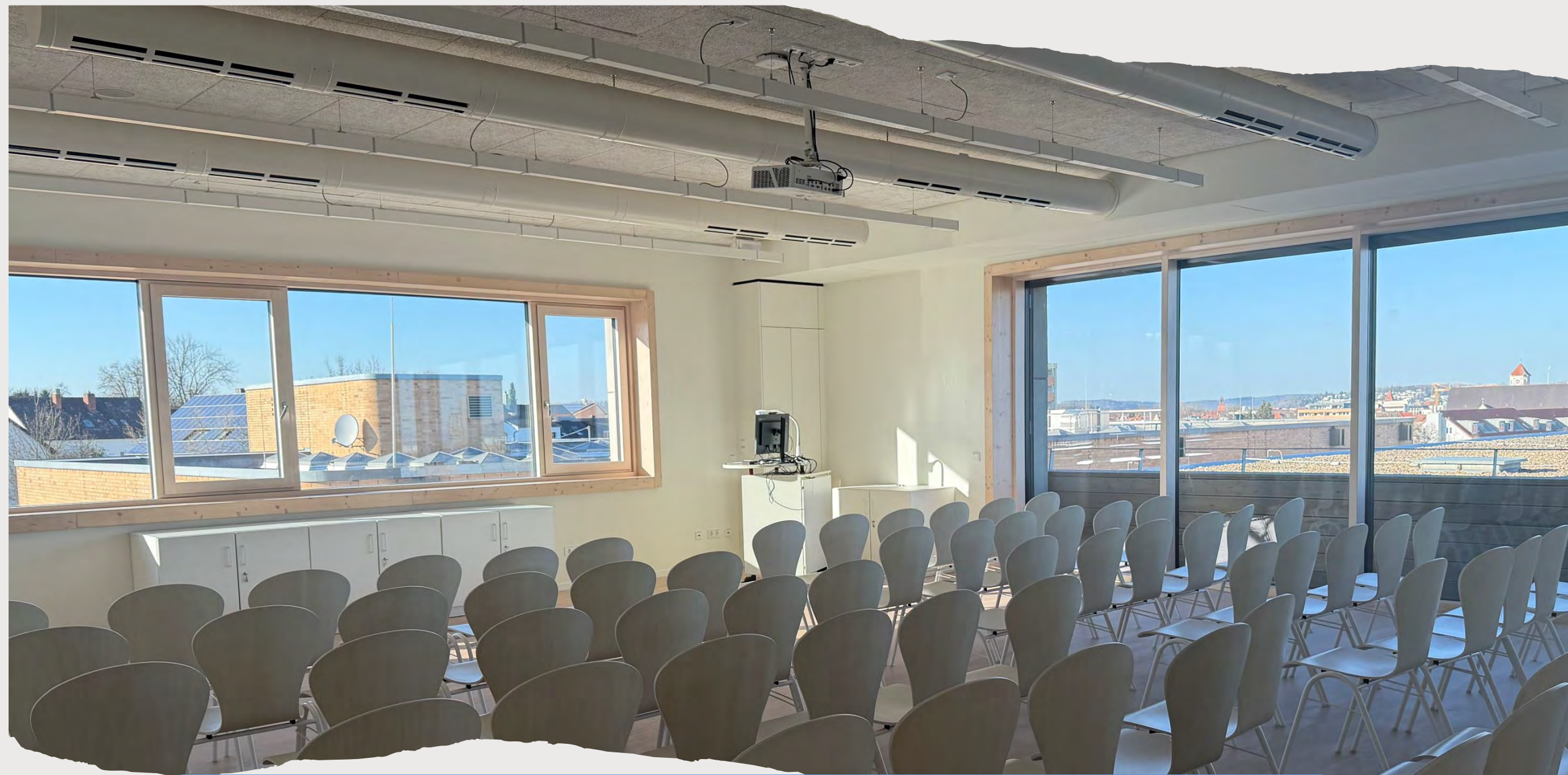
Konferenzraum mit wunderschöner Aussicht