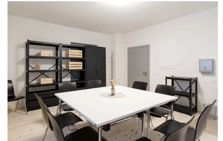
Raum: „Mayerhofferin“ - 22m 2