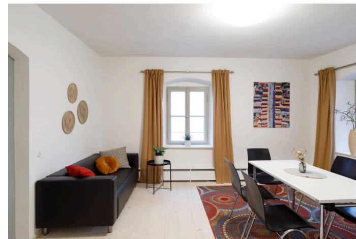
Raum: „Ottin“ - 19m 2