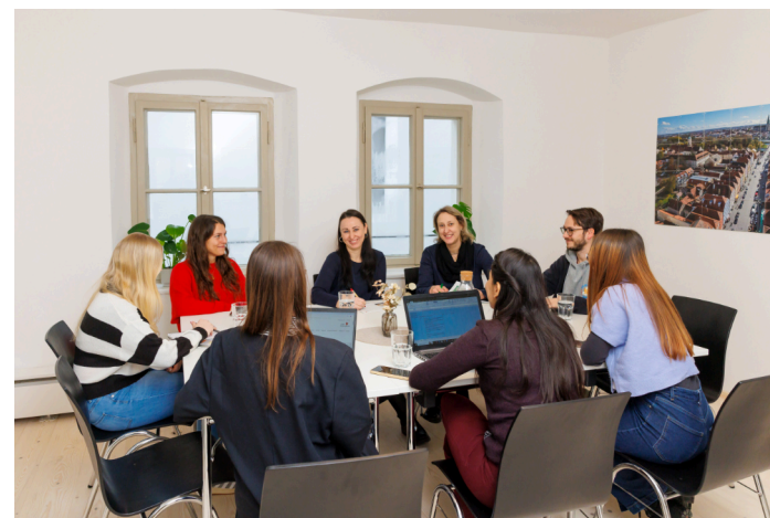
Raum: „Kirchdorfferin“ - 19m 2