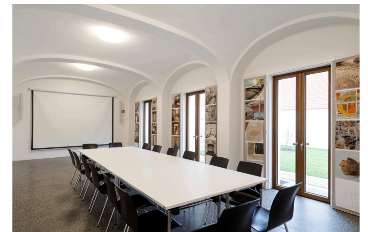
Raum: „Ulrich-Obser-Saal“ - 60m 2