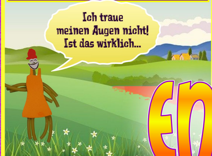
Eines Tages, viele Jahre später, ging Roni wieder einmal spazieren...