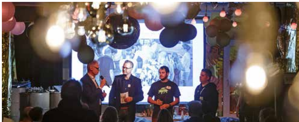
monatliches NETZWERKTREFFEN der Kreativen (05.12.2017)

BUCH | MUSIK | KUNST | FILM | RUNDFUNK | DESIGN | DARSTELLEND KUNST | ARCHITEKTUR | PRESSE | WERBUNG | SOFTWARE-/GAMES | ARTS & CRAFTS