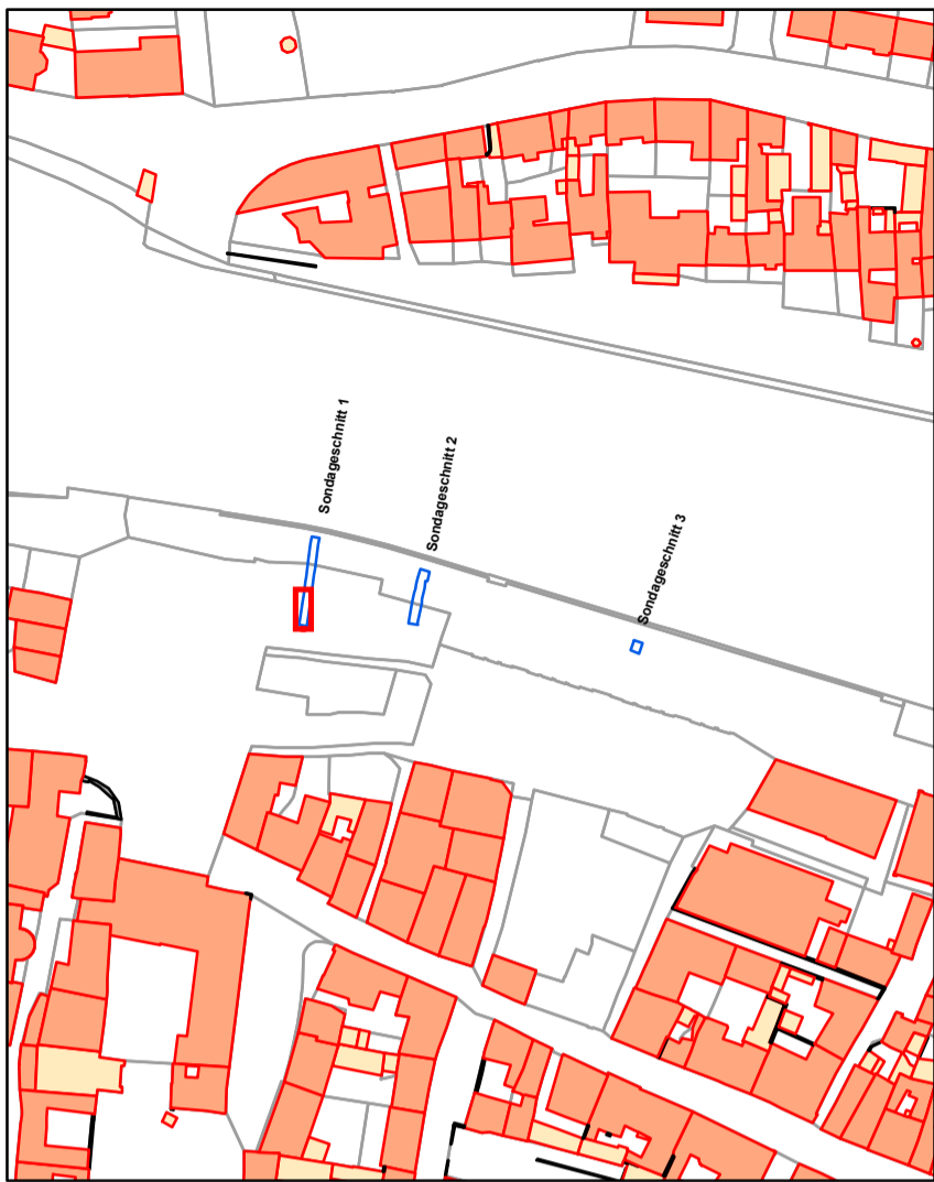
Ausschnitt aus der Flurkarte M 1 : 2 500. Der nebenstehende Planausschnitt ist rot hervorgehoben.