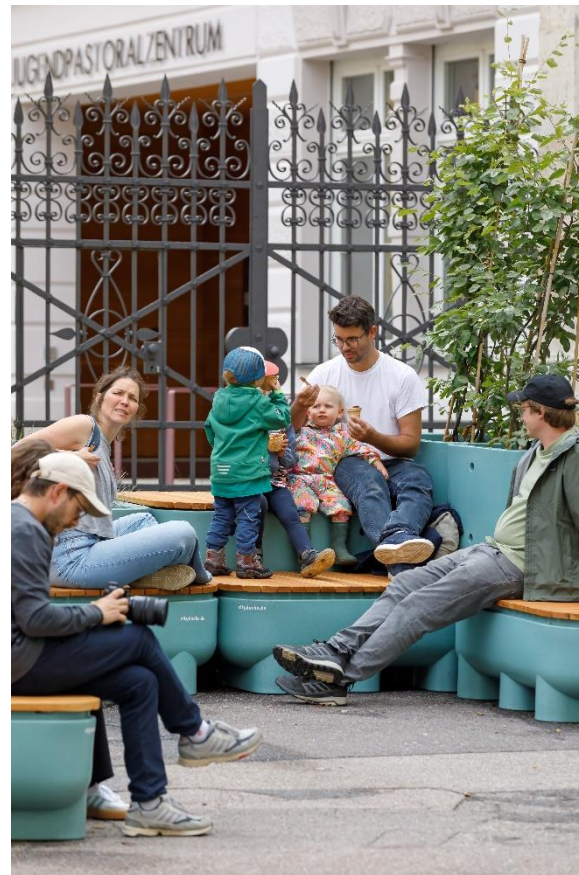
Abb.: Bilddokumentation Stadt Regensburg