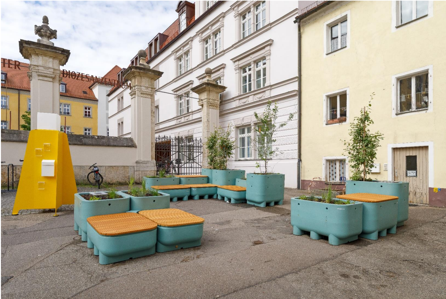
Abb.: Bilddokumentation Stadt Regensburg