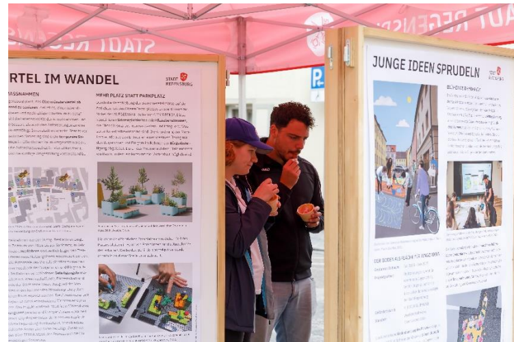
Abb.: Bilddokumentation Stadt Regensburg