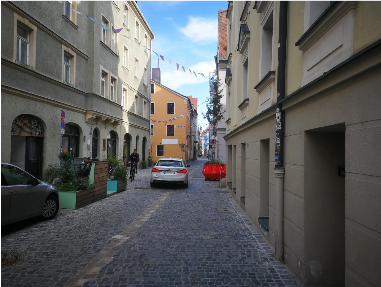
Abb.: Bilddokumentation Stadt Regensburg