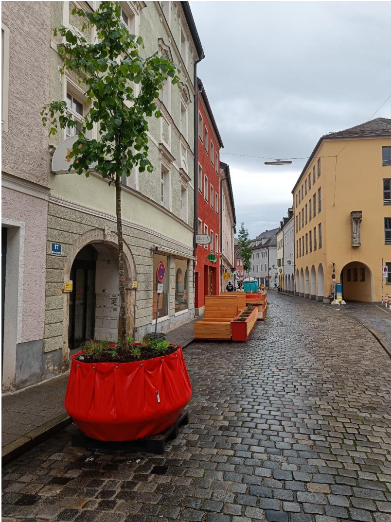
Abb.: Bilddokumentation Stadt Regensburg