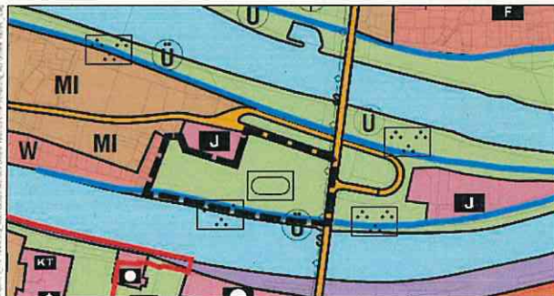
Rechts gültiger Flächennutzungsplan