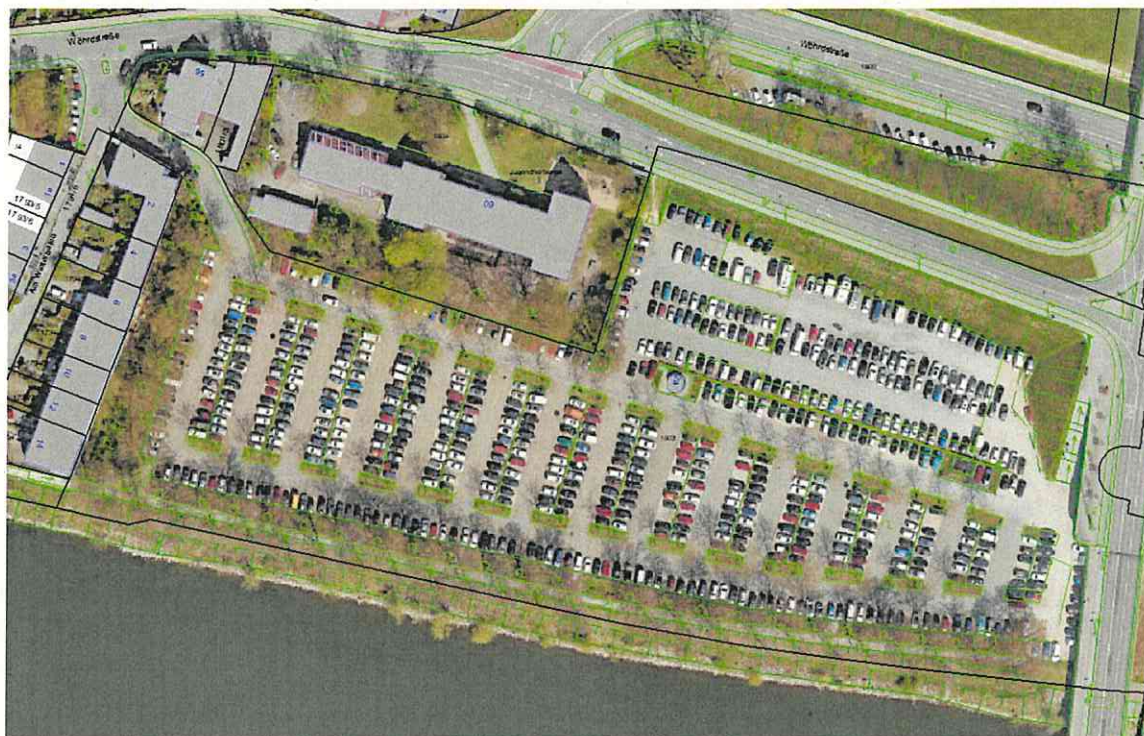
Anlage 1: Ausschnitt CityView (ohne M.)