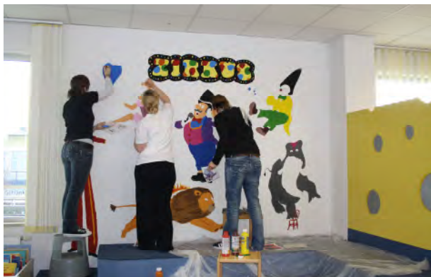
Mitarbeiter in Aktion

„Aufenthaltsqualität“ ist ein wesentliches Kriterium für den Erfolg von Bibliotheken. Im vergangenen Jahr wurde die Stadtbücherei Burgweinting einem Relaunch unterzogen: Der Kinderbereich wurde komplett erneuert unter dem Motto „Zirkus“, ein ansprechender Bereich für Jugendliche und ein angenehmer Bereich für Zeitungsleser wurden geschaffen.