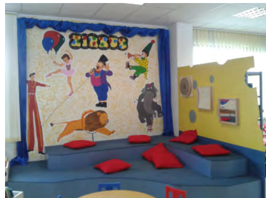
Neu gestaltete Kinderecke