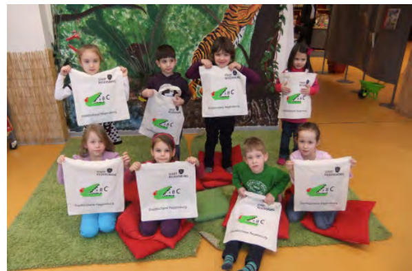
Bib-Profis in Aktion