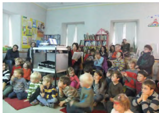
Bilderbuchkino zu „Pinocchio“