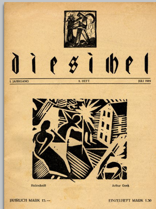
[Die Sichel.]

Etwas in Vergessenheit geraten ist WILLI REINDL (1889-1943), der im Regensburg der 1910er bis 1930er Jahre als künstlerische Mehrfachbegabung gewirkt hat.