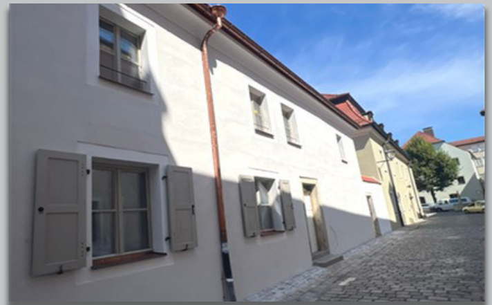
[Das Spitalschreiberhaus. ]