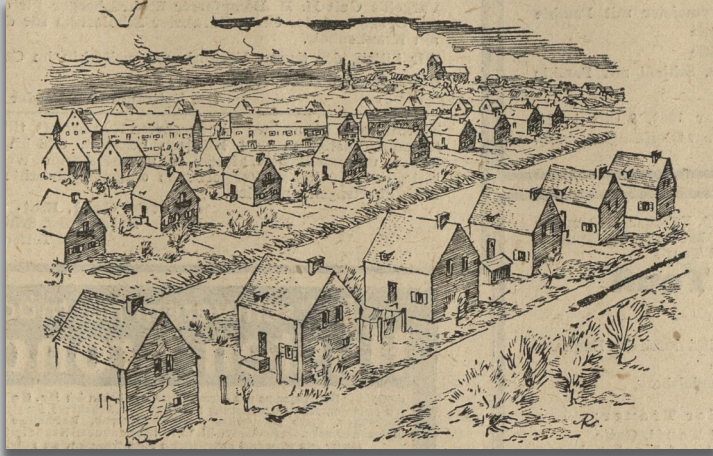
[Zeichnung der Ganghofersiedlung. Stadtarchiv Regensburg, Tagesanzeiger vom 17./18. Februar 1950]

Während der Zeit der nationalsozialistischen Herrschaft entstand am Fuße des Ziegetsbergs im Süden der Stadt Regensburg für die Beschäftigten der Messerschmittwerke die Siedlung Göring-Heim mit der Horst-Wessel-Schule. Mit dem Einmarsch der siegreichen amerikanischen Truppen am 27. April 1945 wurde die Siedlung mit ihrer Schule als Flüchtlingslager der internationalen Flüchtlingsorganisation UNRRA bzw. IRO von der US-Besatzungsmacht beschlagnahmt. Die bisherigen Mieter mussten ihre Wohnungen verlassen und wurden auf das übrige Stadtgebiet verteilt, ein