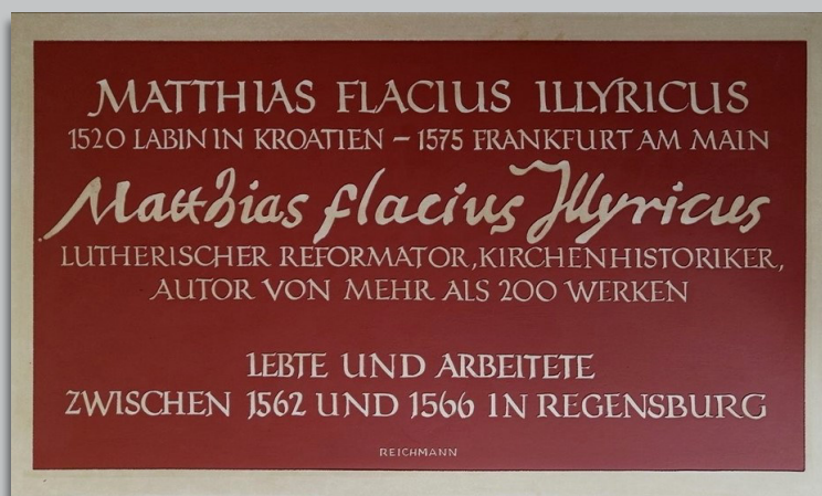
[Die Gedenktafel, die seit Dezember 2023 an Matthias Flacius Illyricus erinnert. ]

MATTHIAS FLACIUS ILLYRICUS (1520–1575) hat einige nicht unwichtige Jahre seines Lebens in Regensburg verbracht. Der aus