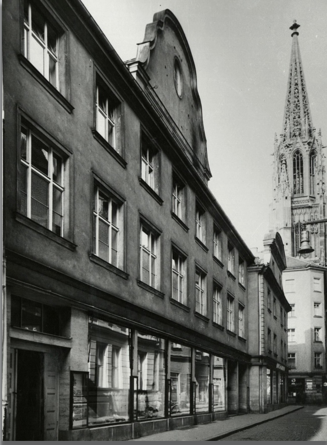
[Kaufhaus vor dem Umbau 1954.]

Mit dem letzten Öffnungstag des Kaufhofs am 20. August 2024 endete eine über hundertjährige Kaufhaustradition am Regensburger Neupfarrplatz. Anstelle des vormaligen Textilhauses „ Hammer “ eröffnete am 6. Mai 1920 der Zwickauer