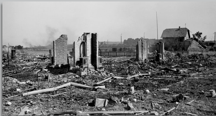
[Zerstörte Hallen auf dem Messerschmittgelände nach dem Angriff vom 17.8.1943. ]