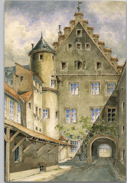
Arnulfplatz 4, Rückansicht, Aquarell von Adolphine Beyschlag, 1892 (Museen der Stadt Regensburg, G 1950/4,4)

Dabei war Sir George Etherege (1635 – 1691) eigentliche Berufung das Theater. Mit spitzer Feder ätzte er in seinen Sittenkomödien gegen den englischen Puritanismus seiner Zeit, sein Stück „ The Man of Mode or, Sir Fopling Flotter “ gehört zu den besten Komödien seiner Zeit.