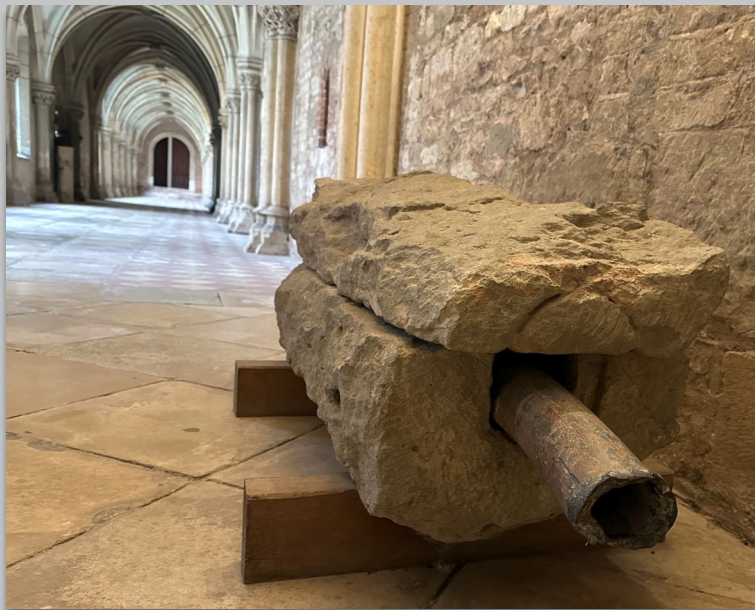
Teilstück der originalen Wasserleitung aus dem Jahr 1200

Abt Peringer dessen Grabmal in der Ramwoldskrypta von St. Emmeram die Inschrift „ qui fecit aquaeductum plumbeum “ trägt, ließ die Wasserleitung im Jahr 1200 nach altrömischer Technik anfertigen: Es wurden Bleirohre in großen Steinquadern verlegt, diese von oben wiederum mit Steinquadern abgedeckt. Zu Recht priesen die Emmeramer Mönche regelmäßig die bis heute älteste Wasserleitung Deutschlands. Sie lieferte zu jeder Zeit sauberes Wasser zum Trinken, zum Waschen, für den Fischteich und natürlich zur Brandbekämpfung.