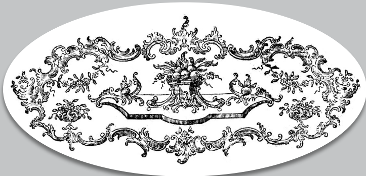
Einblattdruck (Historischer Verein für Oberpfalz und Regensburg, R2113)

Als literarische Neujahrsgratulantinnen traten im 19. Jahrhundert die Regensburger Nachtwächter auf. Am Silvesterabend zogen sie von Haus zu Haus, trugen ihre Glückwünsche vor und überreichten einen gedruckten „Neujahrsbesuch“. Eine Reihe dieser Gelegenheitsdrucke bewahrt heute die Bibliothek des Historischen Vereins. 1808 lauteten einige Verse folgendermaßen: