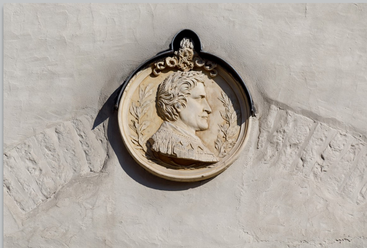
Relief Ludwigs I. am Goldenen Kreuz

Stellen wir uns vor: König Ludwig I. von Bayern wäre noch am Leben und möchte dieses Jahr auf Einladung der Stadt Regensburg und des Hauses der bayerischen Geschichte die ihm gewidmete Landesausstellung besuchen. Wo würde er Logis nehmen? Wahrscheinlich im Goldenen Kreuz, wo er seit seiner Kronprinzenzeit wiederholt übernachtete.