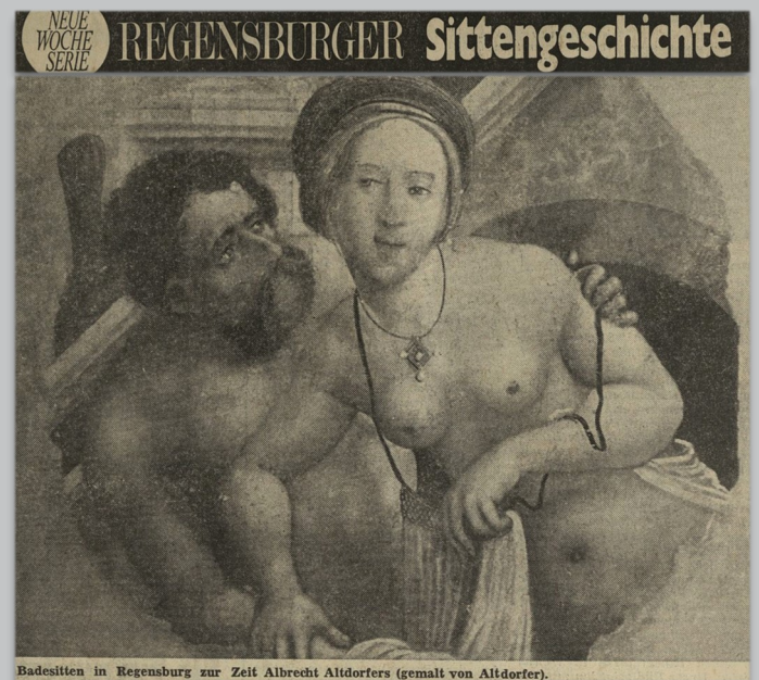
Badesitten in Regensburg zur Zeit Albrecht Altdorfers (gemalt von Altdorfer).

1969 – mitten in der Zeit der „sexuellen Revolution“, also dem Wandel der öffentlichen Sexualmoral im Sinne einer Enttabuisierung sexueller Themen – veröffentlichte die WOCHE eine siebenteilige Serie zur „Sittengeschichte in Regensburg“, die vermeintliche Tabuthemen zum Inhalt hatte: Den Anfang machten „Die Ehebrecher“, „illustriert“ von Altmeister Albrecht Altdorfer :