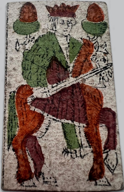
Hauptrechnung 1604/05 (Spitalarchiv Regensburg)

Mal finden sich zerquetschte Fliegen aus der Frühen Neuzeit, ein andermal gepresste Blütenblätter; nicht selten eingelegte Notizzettel oder Quittungen. Einen besonderen Fund hingegen machte eine studentische Mitarbeiterin beim Einscannen der Hauptrechnung des Spitals von 1604/05: