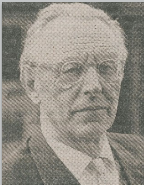
Regensburger Universitätszeitung, Jahrgang 1982, Nr. 3, Seite 6

Er hatte eine enge Verbindung zur Universität Regensburg, nicht nur durch seine ehemaligen