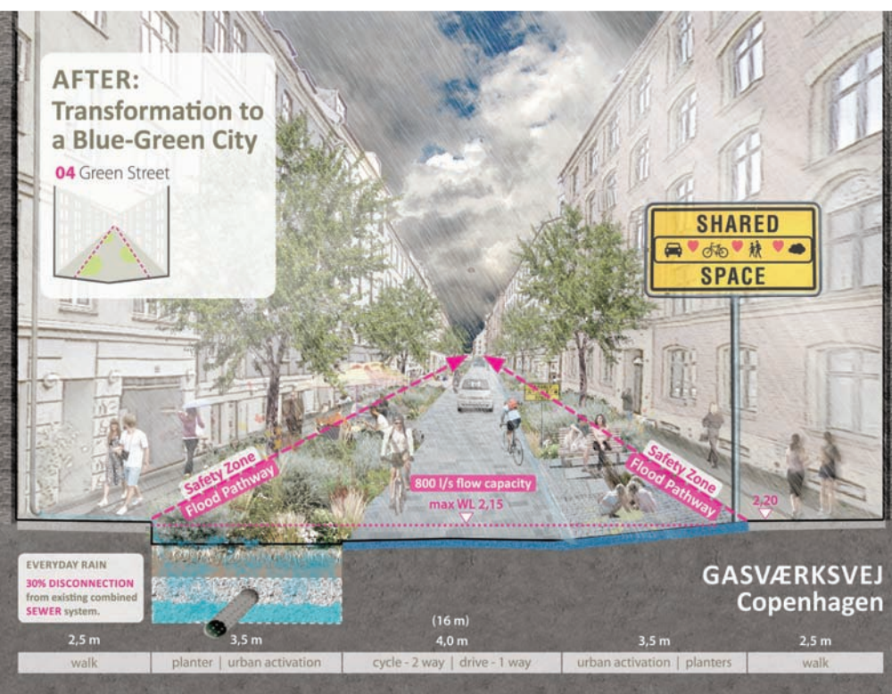
Blue Green City Kopenhagen Konzept und Darstellung: RambollStudio Dreiseitl

Mit Blick auf den Klimawandel sind Freiflächen und insgesamt eine „grüne und blaue Infrastruktur“ unverzichtbar, um ein gesundes Klima in der Stadt aufrechtzuerhalten.