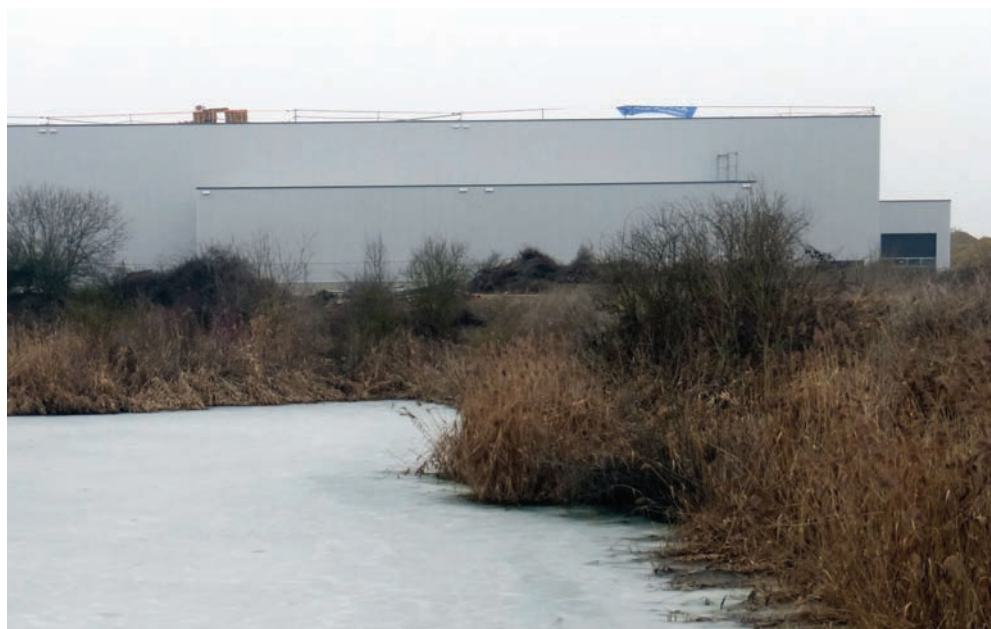
Die Klärteiche bei Irl sollen erhalten und weiterentwickelt werden