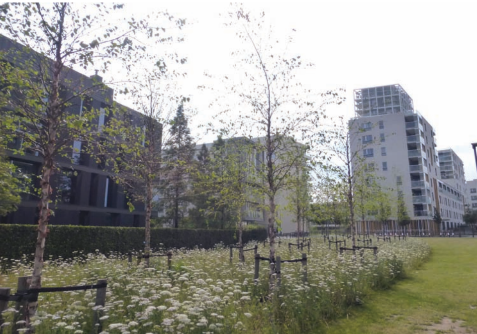
Wiesensäume in einem Neubaugebiet in Antwerpen