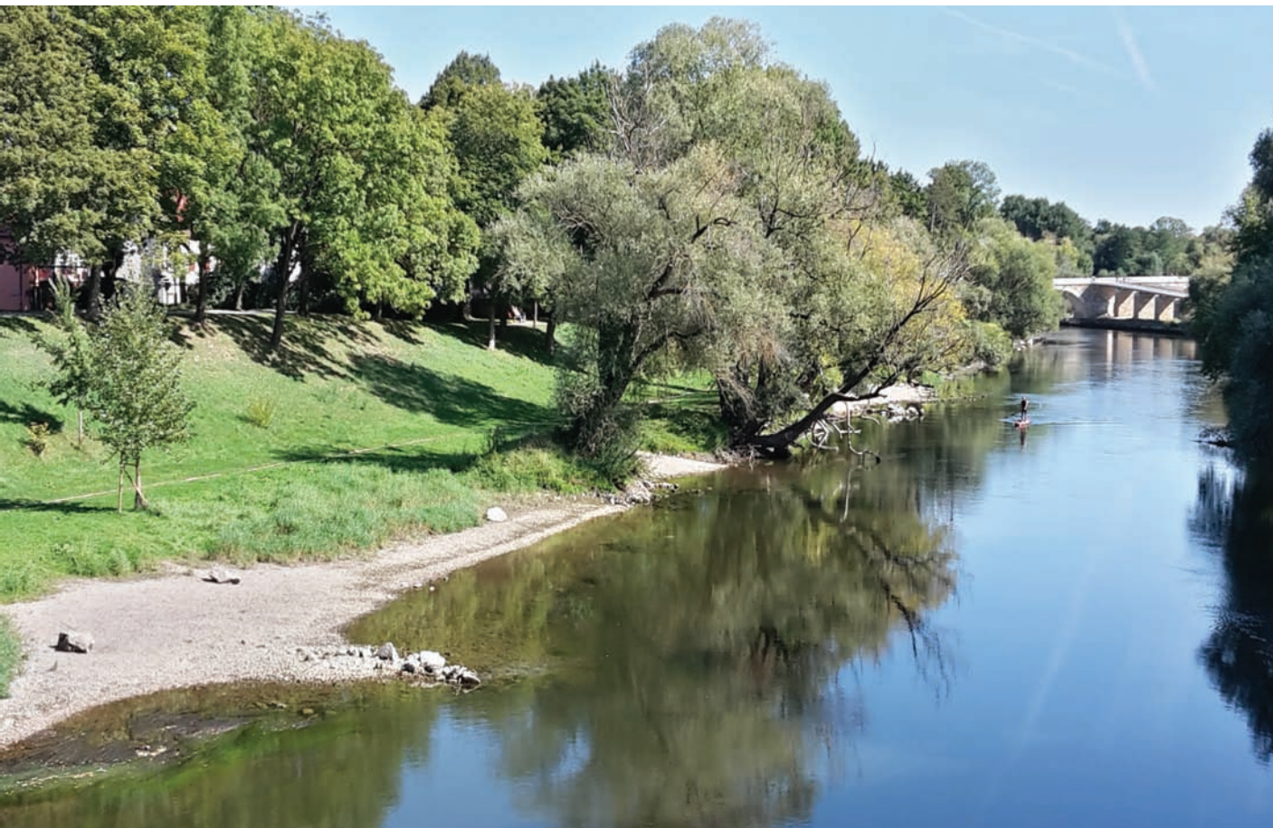
Die gelungene Ufergestaltung des nördl. Donauarms im Bereich der Wöhrde Retentionsraum und Naherholung