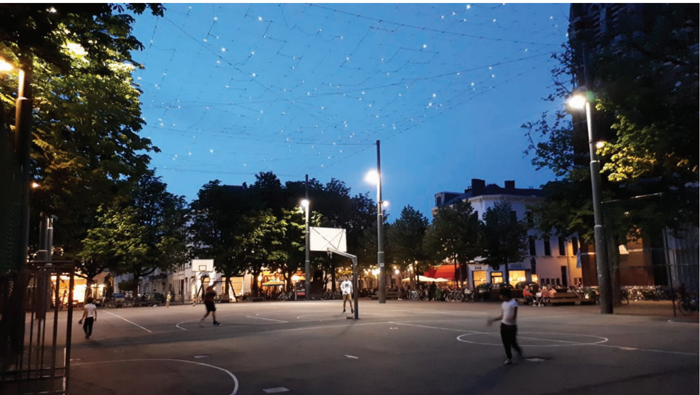
Multifunktionsplatz in innerstädtischem Quartier in Antwerpen

Freiräume sind heute multifunktionale Räume, mögliche Funktionsüberlagerungen müssen geprüft und entwickelt werden