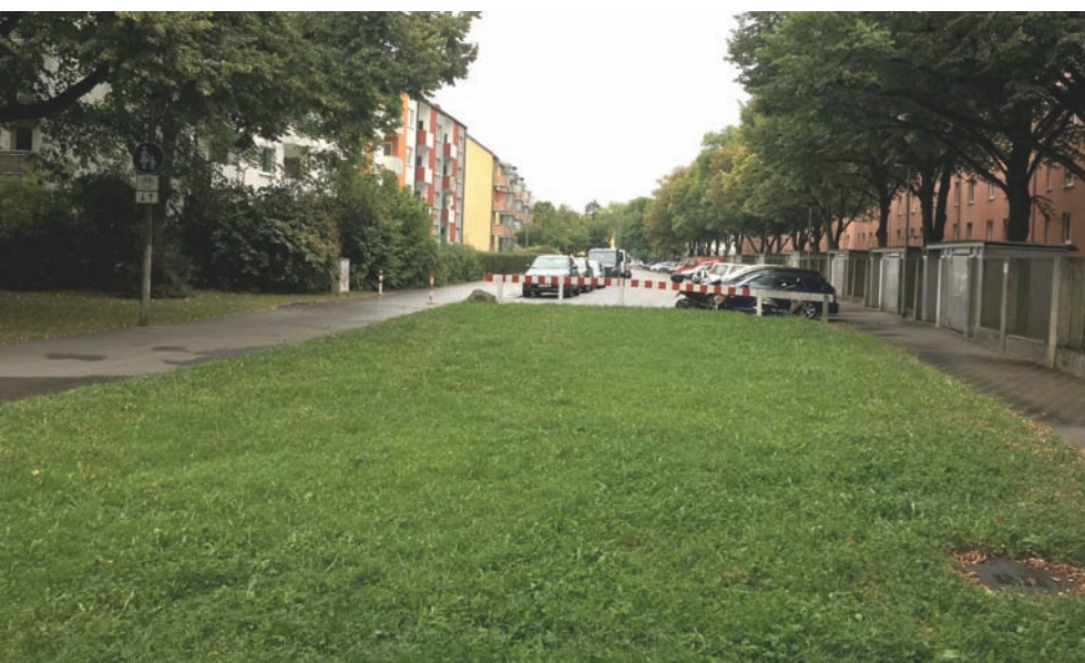
Der grüne Korridor am Burgunderring wartet auf seine Fortführung