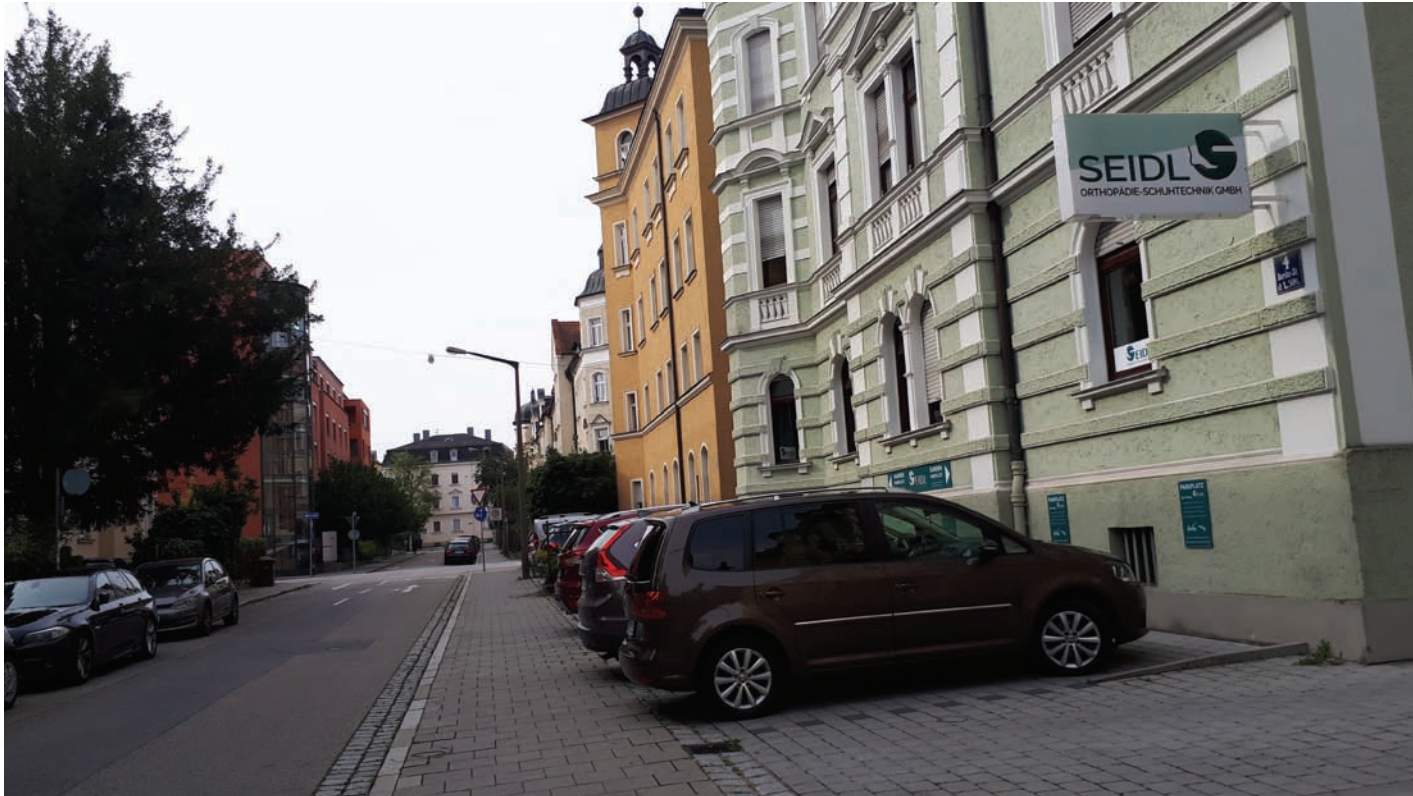
ehem. gründerzeitliche Vorgärten in der Roritzer Straße- heute Parkplatz