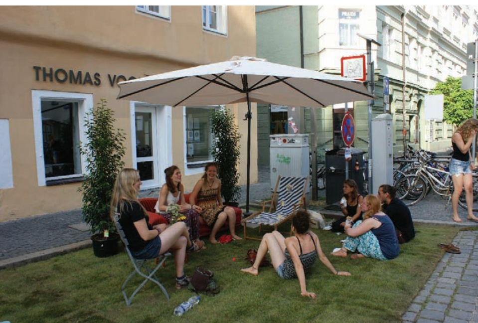
Aktion von Transition und VCD in der Obermünsterstraße

Der motorisierte Individualverkehr ist weiterhin der größte Flächenverbraucher der nicht bebauten Flächen in Regensburg, daher gilt: Nachhaltige öffentliche Räume brauchen die Verkehrswende. Voraussetzung dafür sind öffentliche Räume, die nachhaltige Mobilität attraktiv machen.