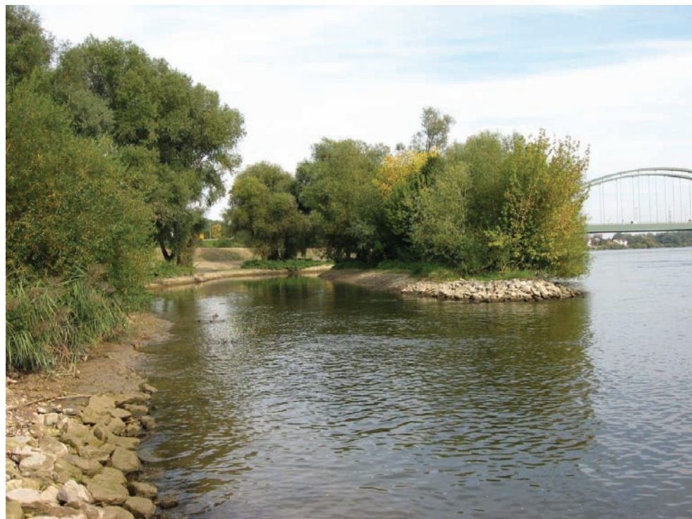
Bei Schwabelweis wurde im Zuge des Hochwasserschutzes ein Seitenarm der Donau angelegt. Es hat sich gezeigt, dass dies einen wertvollen Beitrag zur Bewahrung der Artenvielfalt geleistet hat. In diesem Seitenarm finden sich in großer Zahl seltene Fischarten.