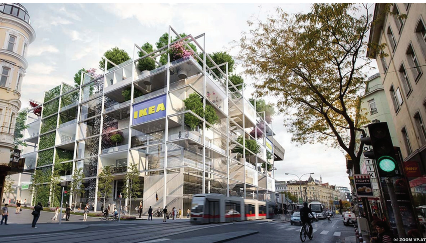
Konzept Neubau Ikea Mariahilferstraße Wien