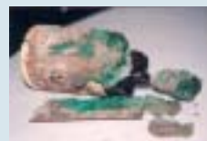
Bohrkern eines Hallenbodens mit grünen Chromverunreinigungen

Aus den Ergebnissen der Erkundung wird ein Rückbau- und Entsorgungskonzept erarbeitet. Es dokumentiert die ermittelten schadstoffhaltigen Gebäudebestandteile, zeigt die erforderlichen Arbeitsschritte für die Schadstoffabtrennung (Reihenfolge, geeignete Verfahren) auf, nennt die Anforderungen an den Arbeits- und Immissionsschutz und schlägt mögliche Entsorgungswege vor.