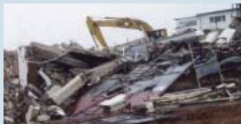
unkontrollierter Abbruch mit unzureichender Abfalltrennung

Dies bedeutet, dass ein Rückbau wie ein Neubau zu planen ist. Die verschiedenen Baustoffe müssen erfasst und geeigneten Rückbauverfahren zugeordnet werden. Schadstoffe und bestimmte Abfallfraktionen (wie z. B. Metall, Beton, Glas oder Kunststoff) müssen separiert werden. Mögliche Entsorgungswege sind zu ermitteln. Dazu muss das Gebäude vorab auf Schadstoffe untersucht werden.