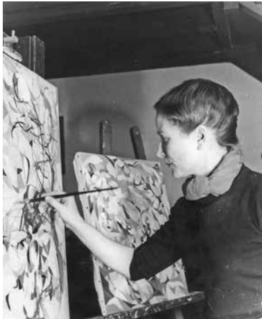
Hélène de Beauvoir an der Staffelei

Die wichtigste Künstlerin des Galeristen, mit der ihn eine enge Freundschaft verband, ist die Malerin Hélène de Beauvoir (1910-2001), Schwester der Schriftstellerin Simone de Beauvoir. In ihrer schöpferischen Auseinandersetzung mit den Strömungen des 20. Jahrhunderts um Picasso, Delaunay und Matisse fand sie ihre eigene überzeugende Formensprache, die sich durch große Freiheit und Poesie auszeichnet. Exklusiv in Deutschland wird ihr Werk - mit Verkauf direkt aus ihrem Nachlass - in einer Dauerausstellung im Galeriebereich gezeigt.