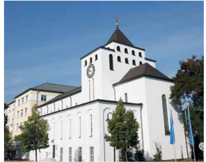
Außenansicht Krankenhaus Barmherzige Brüder

Jährlich finden im Krankenhaus Barmherzige Brüder drei bis vier Kunstausstellungen innerhalb der langjährigen Reihe „Kultur im Krankenhaus“ statt, unterstützt durch den Förderverein des Krankenhauses. Neben Malerei und Zeichnung werden auch ausgewählte Skulpturen, Objekte und Fotografien von regionalen und überregionalen Künstlerinnen und Künstlern gezeigt. Die Ausstellungen werden vom Arbeitskreis „Kultur im Krankenhaus“ unter der Leitung von Kurator Bernhard Löffler organisiert.