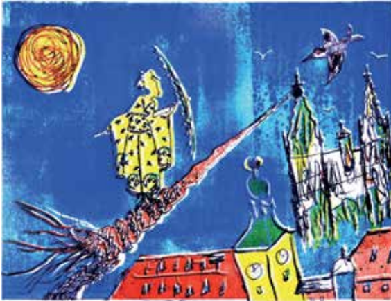
Martin Burgheim, Welterbe, Algrafie auf Karton, 15x20 cm

Opening hours Thu 5pm–7pm and on appointment