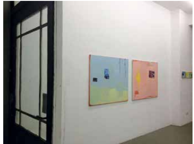
Außenansicht der Galerie mit Arbeiten von Ursula Block-Jopp

Die galerie konstantin b. besteht seit Ende 2001. Sie versteht sich als Plattform für zeitgenössische Kunst von internationalen, überregionalen und regionalen Künstlerinnen und Künstlern. Gezeigt wird im Wechsel bzw. in Kombination Malerei, Grafik, Objekt, Skulptur sowie Fotografie und Installation.