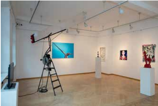
87. Jahresschau 2013, Foto: © Wolfram Schmidt