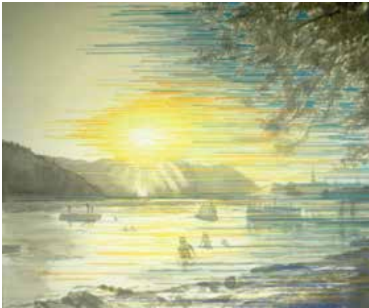
Linda Männel, Heimat II, Tusche und Garn auf Leinwand, 120x140cm, 2014

Tue - Fri 2pm–6pm Sat 12am–4pm and on appointment