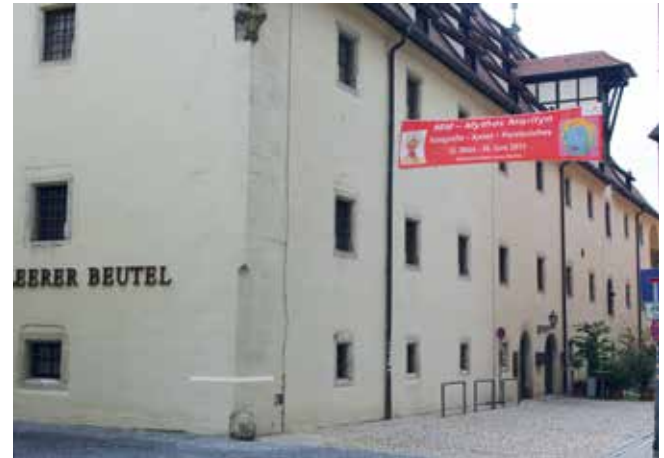
Außenansicht der Städtischen Galerie im Leeren Beutel.

Der einst als Getreidespeicher genutzte „Leere Beutel“, ein stattliches Gebäude des 16./17. Jahrhunderts, dient heute als Städtische Galerie. Seit 1980 werden in drei Etagen sowohl Werke aus der Sammlung ostbayerischer Kunst des 20. Jahrhunderts und der Gegenwart, als auch Wechselausstellungen zur regionalen, nationalen und internationalen Kunst des 20. und 21. Jahrhunderts gezeigt.