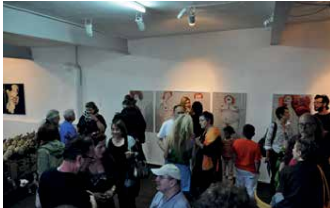
Ausstellungseröffnung "Jenseits von Schön und Gut", Juni 2013

Opening hours during exhibitions Fr and Sat 4pm–7pm