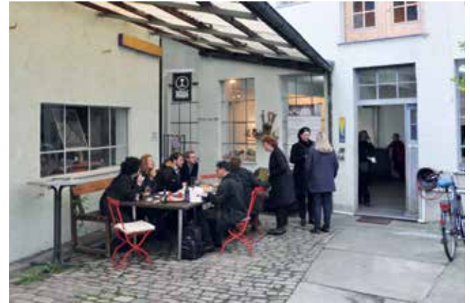
Außenansicht KunstvereinGRAZ

Der KunstvereinGRAZ hat seine Heimat auf dem Gelände der ehemaligen Spenglerei "Steidl" gefunden. Von hier aus trägt er seine Aktivitäten hinaus in die ganze Welt und holt sich Künstlerinnen und Künstler, die zu dem GRAZ-eigenen Erscheinungsbild passen. Um das Domizil des GRAZ zu erreichen, geht der Besucher durch einen Schlauchgang und steht am Ende gewissermaßen bei "Meister Eder".