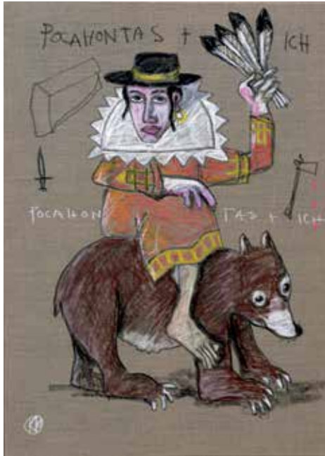
Günther Kempf „Pocahontas + ich“

Öffnungszeiten: 8–20 Uhr täglich Opening Hours: 8am–8pm daily