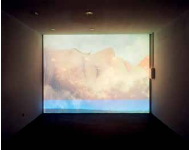
Vertikale Traumebene, Videoinstallation von Annegret Bleisteiner

Opening hours Thu - Fr 4pm–7pm Sa 12am–3pm and on appointment