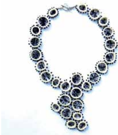
Collier Knochen Glasperlen Silber, Design Brigitte Berndt

Die 1992 gegründete Schmuckgalerie brigitte berndt SCHMUCK stellt neben eigenen Arbeiten zeitgenössische Werke internationaler Schmuckmacherinnen und Schmuckmachern vor. Die drei bis vier Sonderausstellungen im Jahr widmen sich entweder dem Einzelwerk einer bzw. zwei Schmuckkünstlerinnen oder zeigen thematische Gruppenausstellungen.