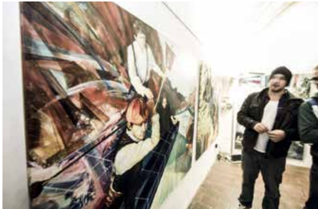
Vernissage der Ausstellung „Tafelsilber“ von Stephanie Walter und Mateusz von Motz, 2013

Opening hours Wed - Fr 5pm–7pm Sat 11am–4pm and on appointment