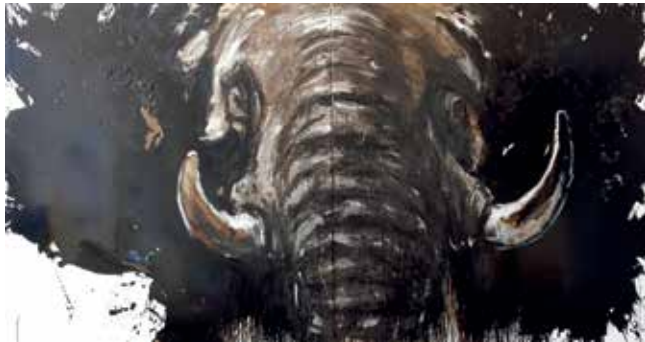
Ralf Koenemann, Elefant 51, 160 x 300 cm, Mixed Media auf Leinwand

Opening hours Tue - Fri 11am–1pm | 2pm–7pm Sat 11am–6pm and on appointment